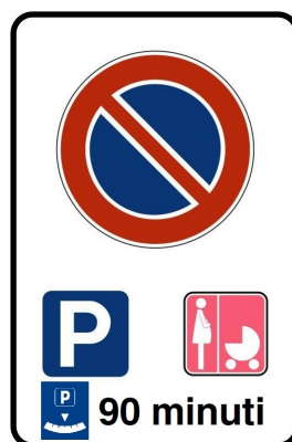
Segnaletica Verticale 90 Minuti Stallo Rosa