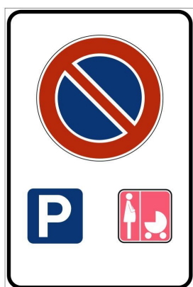
Segnaletica Verticale Generica Stallo Rosa